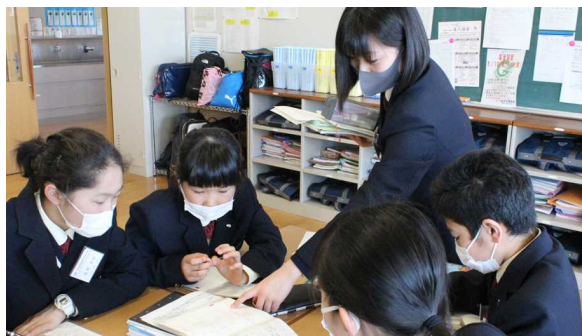
【学習の仕方を指導する3年生「3年生に学ぶ」(5月)】

明日から、約1か月間の夏休みとなります。長かったような短かったような…。1. 2年生は各教科から課題が出されています。3年生は、課題を自分で決めるという新たな取組で行います。「やらされる課題」と捉えるか、「自分を高めるための課題」として取り組むのかで自身の成長に大きな差が出てくることと思います。課題の先に何が目標があると向かい方が変わると思います。例えば「〇月の検定に合格する」「〇月の実力テストで〇点をとる」とか。そうした意義のある取組にしてほしいと思います。また、夏休みだからできることがあると思います。趣味や新たにやってみたいことなど、普段時間をかけてできないことなどにも挑戦してほしいと思います。