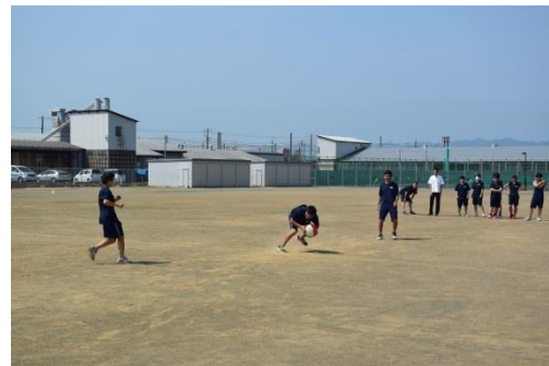
プエルトリコの夏のゲーム

いま、社会から求められている力の一つに、『多様性を尊重し、異文化を受け入れながら組織力を高める力』があげられています。今後、社会全体として、多様な価値観を持つ人々とともに働く機会が増えていくと言われ、いろいろな考えをお互い尊重しながら理解しあうこと、そのためのコミュニケーション能力が求められています。今日は、さまざまな文化に触れることができ、貴重な体験となりました。各地域から来たALTのみなさん、ありがとうございました。