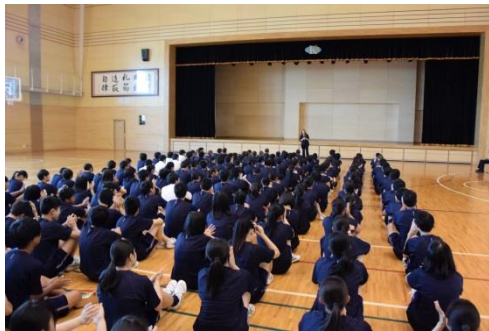
オープニング セレモニー

6月20日(火)に2年生全員が、県内のALTとの交流を楽しみました。第1体育館でのオープニングセレモニーの後、各クラスに分かれて、それぞれの先生とのワークショップに取り組みました。