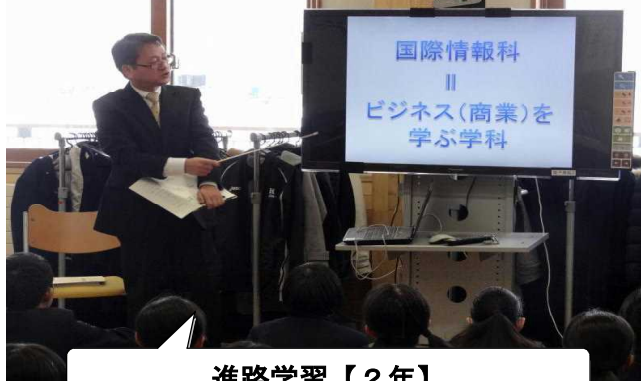
進路学習【2年】 国際情報科について学ぶ(2/2)