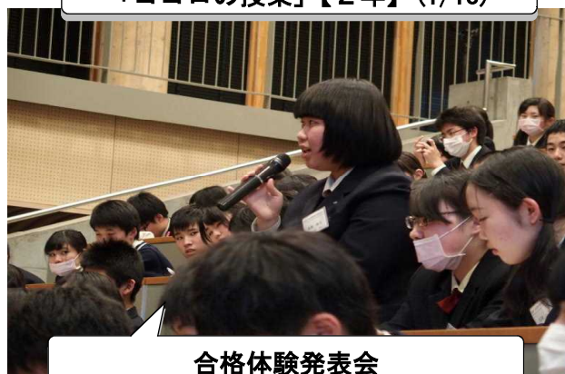
合格体験発表会 高校生に質問する中学生(2/16)