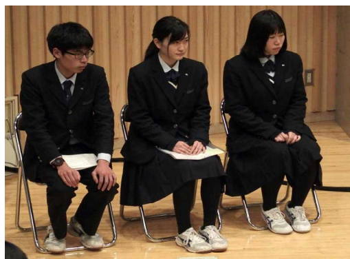
合格体験発表した高校3年生

このように間近で先輩の足跡から学ぶことができるKJ生ならではの幸せをこれからの学校生活に結びつけてくれることを期待しています。