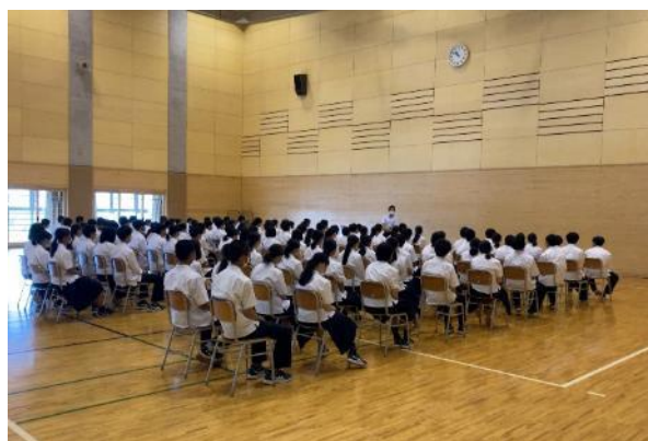
↑各学年集会の様子