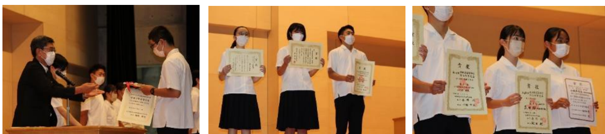
↑文化部、運動部数多くの入賞者を称えました。