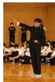
山田先生渾身のエール